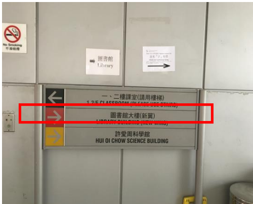
4. 見到指示牌 (如圖示) 向右行