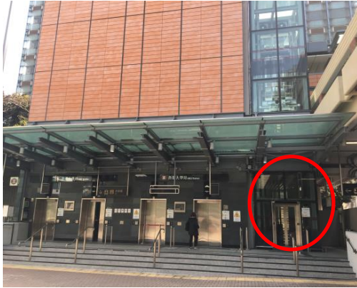
1. 香港大學站 A1 出口 (薄扶林道)，地面轉電梯(紅圈內)，按 "L2" (電梯後面亦有樓梯直上)