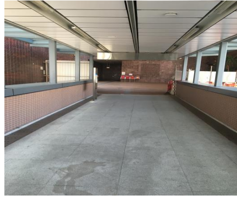
2. 電梯到達 "L2"，天橋盡頭轉左