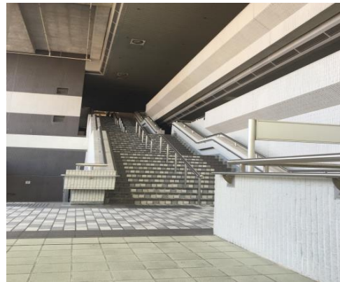
5. 到達圖書館大樓新翼 (地圖紅圈位置: 30B)，直上樓梯第二層