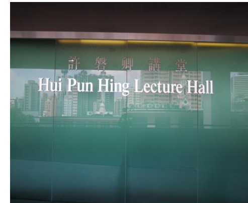
6. 許磐卿講堂 (L2 講堂隔鄰)